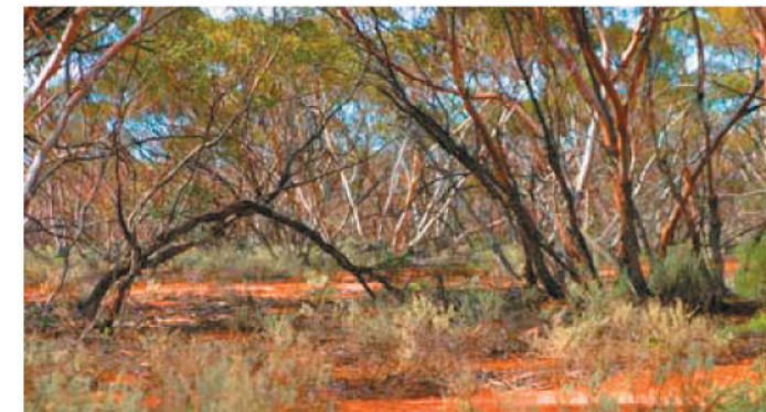
Mallee-Vegetation, wie man sie in Westaustralien findet

Viele Gewächse aus Australien sind zwar sehr gut an Hitze und Trockenheit angepasst, kommen aber mit unseren Schweizer Wintern kaum zurecht. Dies ist denn auch ein Grund, warum nur wenige „Australier“ den Sprung in unsere Gärten geschafft haben. Im Botanischen Garten zeigen wir vor allem eine Auswahl von Kübelpflanzen und Einjährigen, weil selbst die milde Lage am Altenbergrain nicht ausreicht, um die zarten Geschöpfe aus dem Süden das ganze Jahr draussen zu halten. So wird der Eukalyptusbaum, die Futterpflanze der Koalabären, vor dem ersten Frost in die sichere Orangerie gebracht.