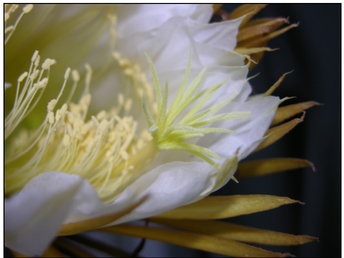
Die Königin der Nacht in voller Blüte (rechts Detailaufnahme)