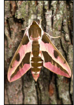
Wolfsmilchschwärmer: Raupe auf Palisadenwolfsmilch Puppe Falter