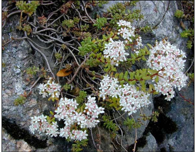
Weisser Mauerpfeffer F: A.L. Anderberg Weisser Mauerpfeffer