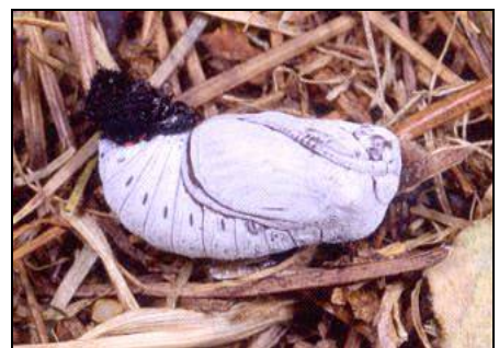
Apollofalter Apollo: Raupe auf W. Mauerpfeffer und Puppe

Durch die Intensivlandwirtschaft mit ihren Monokulturen und der Zersiedelung der Landschaft verlieren immer mehr Schmetterlinge ihre Lebensräume . Gärten und Parks mit exotischem Grün helfen auch mit, dass es für Schmetterlinge keinen Platz mehr hat. Seit 2002 benötigen 56 Tagfalterarten (29%) ein Schutzprogramm, um zu überleben. Pro Natura engagiert sich stark im Schmetterlingsschutz. Mit ihrer Kampagne " Mehr Platz für Schmetterlinge " setzt sich die Umweltorganisation dafür ein, dass Schmetterlinge wieder in die Kulturlandschaft zurückkehren können.